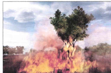
QUÍMICOS – TÉCNICOS